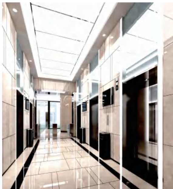
效果图 实际解释权归华成集团所有